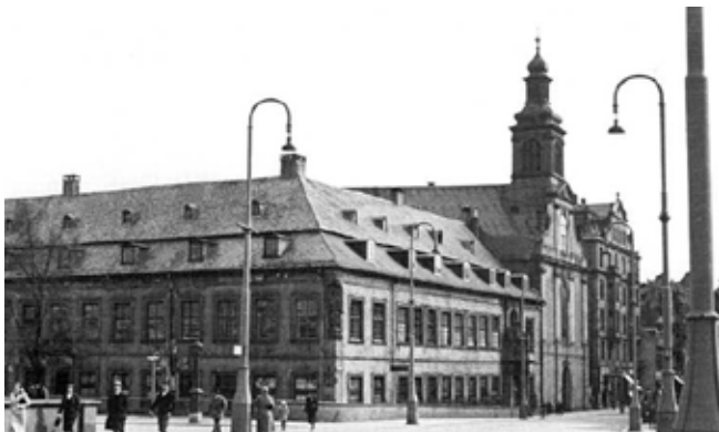
Deutschordenskirche 1945