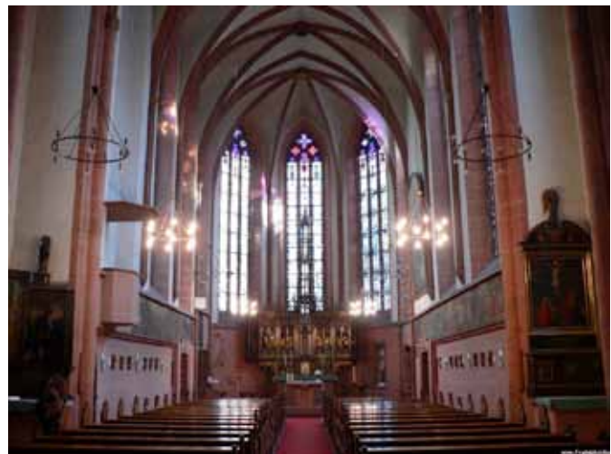
Deutschordenskirche von Innen

Außerdem steht in dieser Kapelle noch eine Reliquie, die angeblich ein Stück des Kreuzes Jesu beinhaltet.